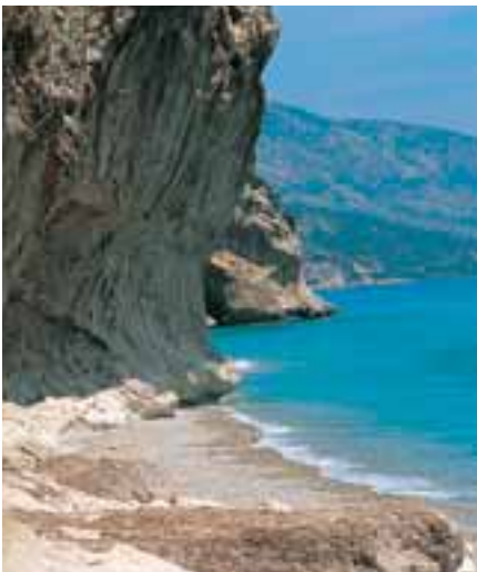
▲ Uno dei tratti più suggestivi della costa di Cala Gonone: Cala Luna e la sua spiaggia.

In macchina, partendo da Dorgali e seguendo la S.S. 125 in direzione di Orosei, si raggiunge la Grotta di Ispinigoli (deviazione al km 32,600). È una delle più grandi d'Italia, con uno sviluppo di 10 km, e la si visita su un percorso guidato e ben attrezzato e illuminato. Particolarmente suggestiva è la grande sala dove una colonna alta 38 m unisce la volta con la base della grotta.