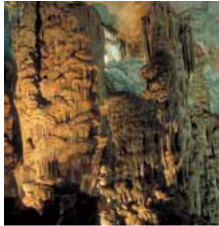
▲ La grande colonna naturale che sembra sorreggere la volta della Grotta di Ispinigoli.

Lungo il litorale di Cala Gonone (NU), a 4 km a sud del porto, si trova la Grotta del Bue Marino, così chiamata perché un tempo era abitata dalla foca monaca, che nella parte più interna si ritirava per partorire o in cerca di rifugio. La grotta, scavata nelle alte falesie calcaree dall'azione delle acque, è raggiungibile facilmente per mezzo di un efficiente ser-