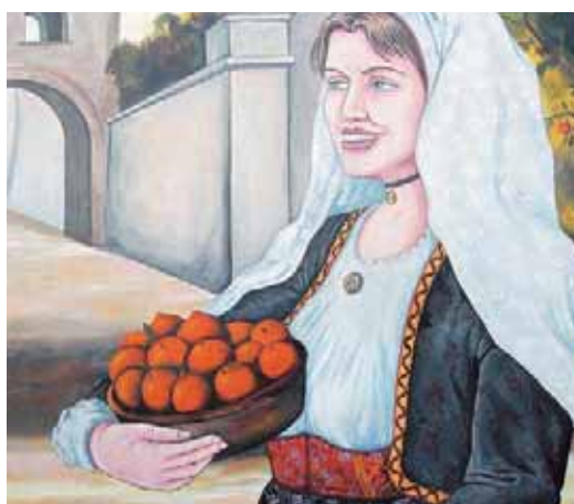
Murale con una donna nel tipico costume sardo e una cesta d'arance. In alto la minestra di verza.

insomma, dell'alimentazione. Ancora oggi i "melloni" gustosissimi dell'area di Orosei, insieme agli agrumi (soprattutto arance di tipo Tarocco e Washington; e mandaranci), sono una delle principali fonti di reddito per non poche famiglie di contadini.