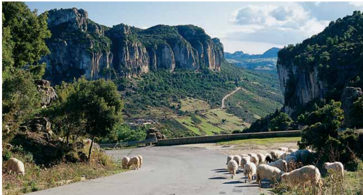
Sopra: la strada tra Perdasdefogu e Ulassai, su cui vigilano i maestosi tacchi, è tra quelle più panoramiche dell'Isola.

na 60 mila residenti, una densità di 32 abitanti per chilometro quadrato). Gli scorci regalano emozioni senza fine: attraversano vallate e pianure fino a perdersi nel verde cristallino del mare. Qui la natura è superba e selvaggia. Lanusei è una terrazza naturale sul golfo di Arbatax: sulla costa si aprono le spiagge di Tortoli e Barisardo, i due poli turistici più importanti, con alberghi e ristoranti che offrono i prelibati e genuini piatti della tradizione ogliastrina.