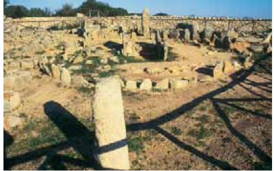
1.4 - Arzachena, circoli tombali dell'età del Rame a Li Muri.