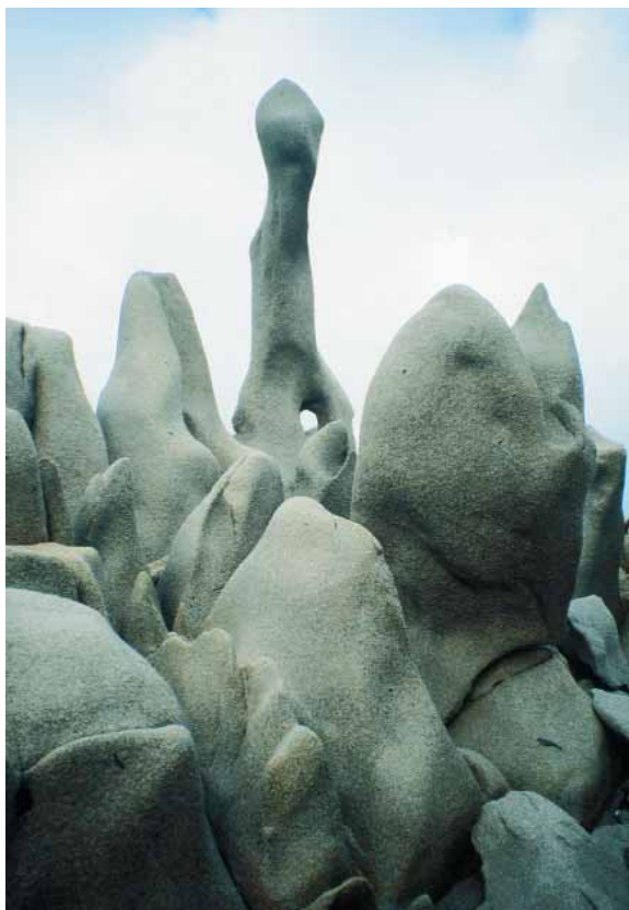
1.2 - Santa Teresa, fantasmagoria di graniti a Capo Testa.

Il resto della sua flotta passando sotto Caprera ricevette una tale scarica di palle che sulle coperte avvenne una strage: 210 morti e moltissimi feriti. È dubbio se