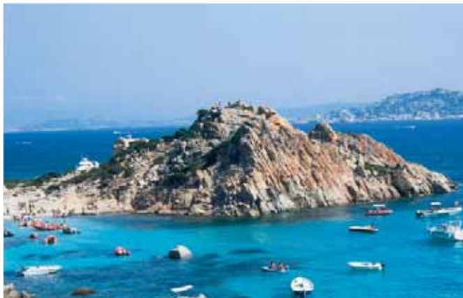
1.1 - L'isola di Budelli nell'arcipelago della Maddalena.

(Carta IGM 1:25000, F° 411 Sez. II - S. Teresa di Gallura)