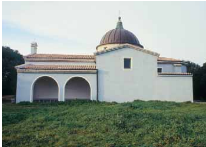
1.3 - Santa Teresa, il santuario campestre del Buon Cammino.

Preferiamo dunque affrontare 7,8 km d'asfalto lungo la S.S. 200 e quindi innestarci, all'altezza dell'insediamento turistico di Rena Majore (al km 64,2), sulla prima strada bianca - quella di sinistra - che viene percorsa per 1,3 km in mezzo a una bella pineta e, finita que-