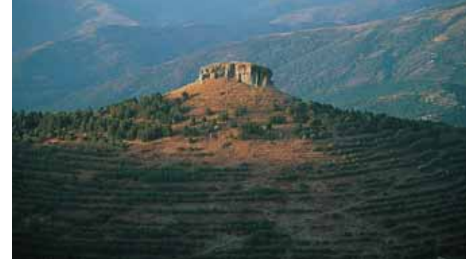
DANIELE PELLEGRINI (2)

130 MILIONI DI ANNI FA (fine del Giurassico). La regione riemerge definitivamente. Sul vasto altopiano calcareo si forma una rete idrografica che dà origine a profonde valli e rilievi calcarei isolati: appunto i tacchi. Negli ultimi 7 milioni di anni (Plio-pleistocene) l'erosione fluviale e carsica causa una drastica riduzione dei calcari e il riaffioramento delle rocce paleozoiche (570-240 milioni di anni fa). Un processo che continua sotto i nostri occhi. (Valerio Agnesi)