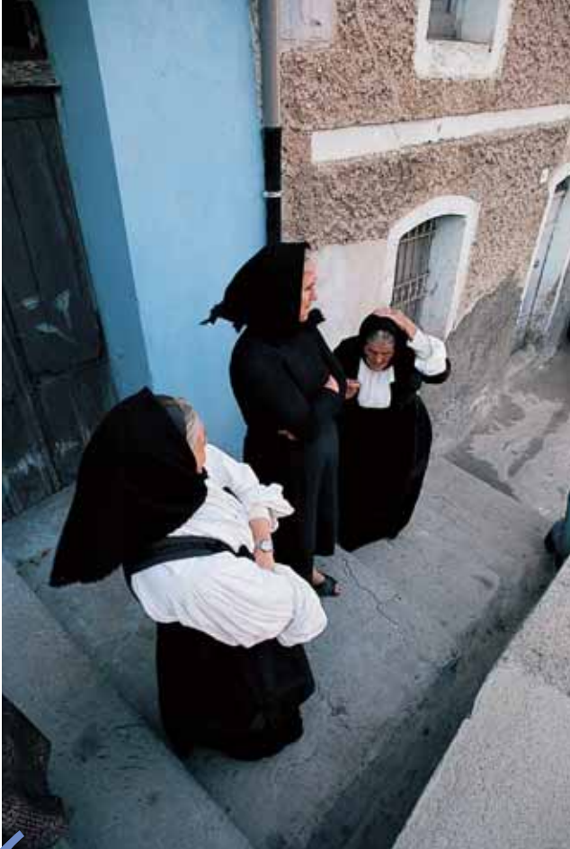
DONNE DI DÈSULO NEL TIPICO COSTUME BARBARICINO. IL PAESE SI TROVA NEL PARCO NAZIONALE DEL GENNARGENTU, ISTITUITO CON DECRETO MINISTERIALE NEL 1998 MA DURAMENTE OSTEGGIATO DALLA POPOLAZIONE LOCALE.