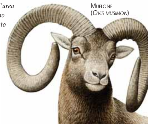
MUFLONE (OVIS MUSIMON)

QUI VIVONO diverse coppie di aquila reale, che beneficiano dell'abbondanza di mufloni, lepri, piccoli mammiferi e serpenti. La pernice è presente anche alle quote più alte, dove nidificano