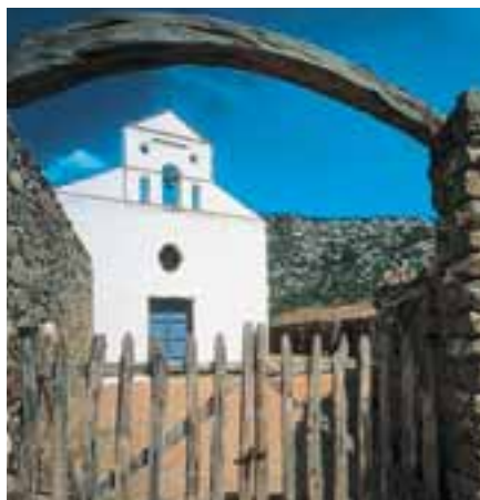
▲ La semplice facciata bianca di San Pietro in Golgo, la chiesetta dell'Altopiano.

Il Supramonte è un vasto altopiano carbonatico, cioè costituito in prevalenza da calcari e dolomie risalenti all'era mesozoica, che comprende i comuni di Orgosolo, Oliena, Dorgali, Urzulei e Baunei. Quello di Baunei si estende a nord-est del paese e può essere considerato un immenso piano inclinato che si protende verso il Tirreno. Esso è noto soprattutto per le sue architetture rocciose, tra le più belle della Sardegna, che si affacciano sul mare cristallino della costa orientale con alte falesie bianche meta di appassionati dell'arrampicata sportiva.