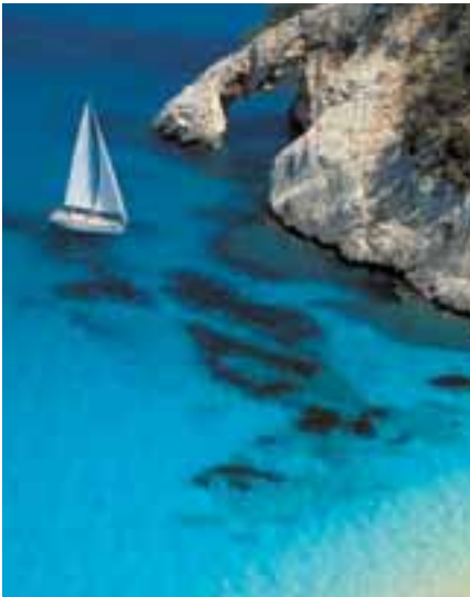
▲ L'arco scavato dalle onde nella roccia di Cala Goloritzè (Golfo di Orosei).

L'altopiano del Golgo è anche il punto di partenza per le escursioni che conducono alla