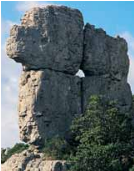
▲ Una delle caratteristiche formazioni rocciose della zona note come "tacchi".

Lasciata l'Orientale Sarda al valico Genna e' Cresia (Porta della Chiesa) una strada in salita in un paesaggio quasi d'alta montagna con vedute panoramiche sulle valli sottostanti conduce a Jerzu (427 m) dove si possono trovare, tra l'altro, tutte le varianti del vino Cannonau. Dopo una breve deviazione per visitare Ulassai, si prende per Perdasdefogu attraversando una zona pittoresca e panoramica caratterizzata da alti tacchi, cioè pareti strapiombanti di altipiani calcarei molto diffusi nella zona. Superati Perdasdefogu e il vicino