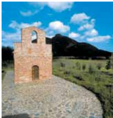
▲ La chiesetta di San Nicola, raro esempio in Sardegna di romanico in mattoni cotti.

Imboccata la S.S. 125 Orientale Sarda in direzione nord e superato il bivio per Porto Corrallo, si continua su un percorso sempre lontano dal mare e più movimentato che, dopo il passo di Genna Arrela, immette nel Salto (il termine equivale a regione incolta) di Quirra. A 15 km circa da Villaputzu si incontra la chiesa di San Nicola o Nicolò, unico esempio in Sardegna di costruzione romanica in mattoni cotti. Sulla destra si notano i ruderi del castello di Quirra, costruito intorno al Duecento dai "giudici" di Cagliari a difesa dei confini con il Giudicato di Gallura. Qualche chilometro dopo si entra nella regione dell'Oglia-